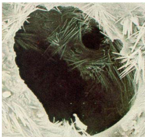
Agrosil ® LR – colloïde